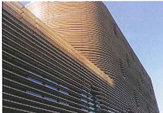
Des brise-soleil laqués qui donnent un aspect « onctueux » au bâtiment.